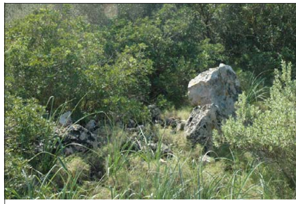
Descripción: Muro y niveles de derrumbe. Unidad 64.1