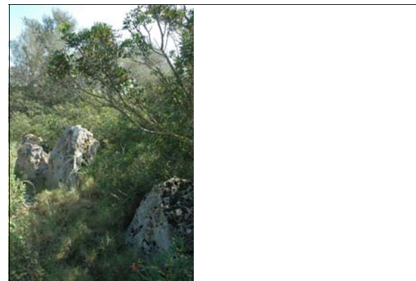
Descripción: Vista del muro de mayor altura ubicado al NO del yacimiento. Unidad 64.