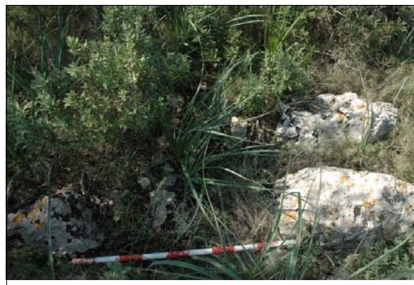
Descripción: Paramento de uno de los muros con escasa altura. Unidad 64.2