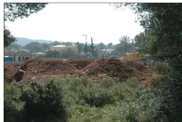
Descripción: Movimientos de tierra en el entorno del yacimiento