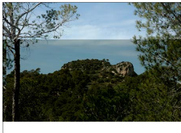
Descripción: Vista desde el yacimiento del Puig de Sa Morisca.