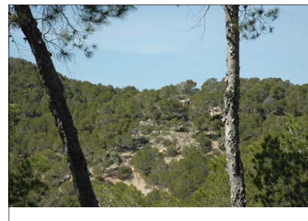
Descripción: Vista del yacimiento Santa Ponsa 5 desde el enclave.