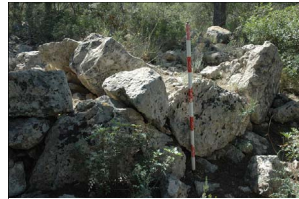
Descripción: Vista del paramento externo.