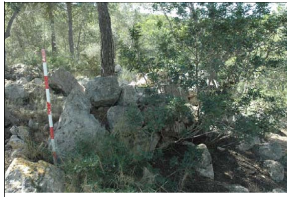
Descripción: Muro norte de la estructura, el que presenta mejor estado de conservación.