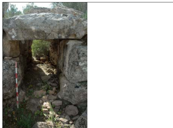
Descripción Imagen de la puerta y corredor de acceso desde el interior.