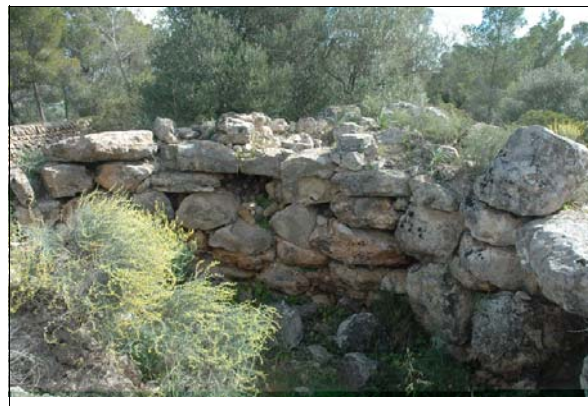
Descripción: Muro interior mejor conservado del talayot.