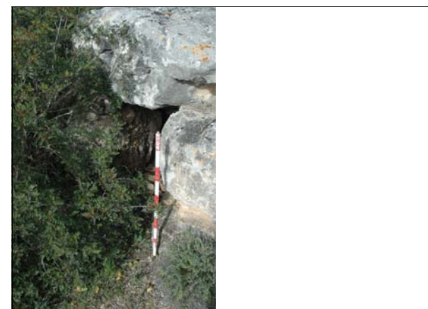
Descripción: Vista exterior.