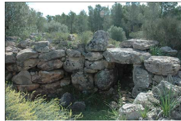
Descripción: Imagen del portal desde el interior.